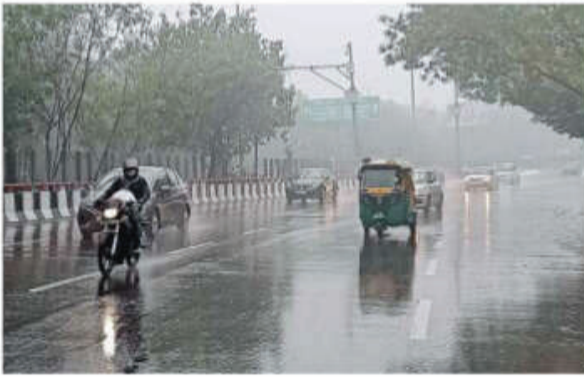
बारिश से दिल्ली का मौसम हुआ सुहावना।

ठंड के साथ कई सड़कों पर जलभराव के कारण यातायात बाधित