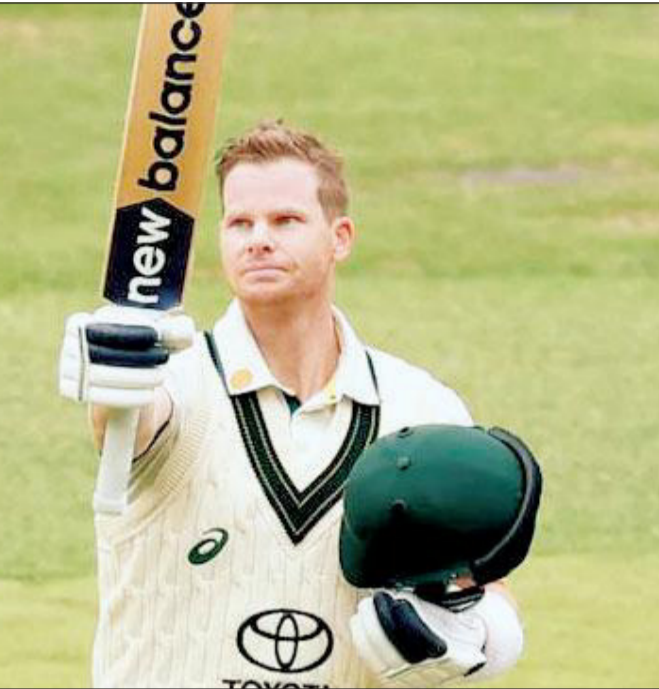
भारत के खिलाफ शतक लगाने के बाद दर्शकों का अभिवादन स्वीकारते ऑस्ट्रेलियाई बल्लेबाज स्टीव स्मिथ।

शुक्रवार को रिकॉर्ड की सूची में स्मिथ का नाम चर्चा में रहा। स्मिथ 34वां टेस्ट शतक लगाने वाले तीसरे सबसे तेज बल्लेबाज बन गए। वे बॉर्डर-गावस्कर ट्रॉफी (बीजीटी) में सबसे ज्यादा शतक लगाने वाले बल्लेबाज भी हैं। कप्तान पैट कर्मिस ने बीजीटी में सबसे ज्यादा विकेट ले