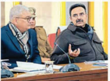
हरियाणा विधानसभा अध्यक्ष सरकार के मुख्य सचिव के साथ बैठक करते हुए।

चंडीगढ़ दिसंबर : हरियाणा विधानसभा अध्यक्ष हरविन्द कल्याण ने शुक्रवार को सरकार के मुख्य सचिव विवेक जोशी समेत वरिष्ठ अधिकारियों के साथ बैठक की। बैठक में विधानसभा के कामकाज और सचिवालय से संबंधित अनेक मसलों पर चर्चा हुई। मुख्य सचिव ने सभी विषयों पर बैठक करके अधिकारियों को उचित निर्देश देने