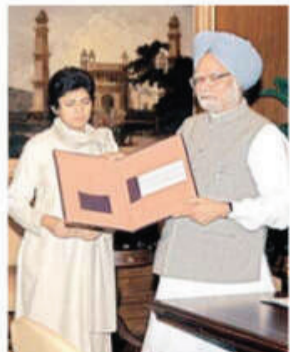
पूर्व प्रधानमंत्री डा. मनमोहन सिंह के साथ कुमारी सैलजा। (फाइल फोटो)

चंडीगढ़, दिसंबर : अखिल भारतीय कांग्रेस कमेटी की महासचिव, पूर्व केंद्रीय मंत्री, उत्तराखंड की प्रभारी, सिरसा की सांसद कुमारी सैलजा ने पूर्व प्रधानमंत्री डा. मनमोहन सिंह के निधन पर गहरा शोक व्यक्त करते हुए कहा कि उनके निधन की सूचना से मन बेहद आहत है। उनका जाना पूरे देश के लिए एक अपूरणीय क्षति है, लेकिन मेरे लिए यह परिवार के एक बड़े और मार्गदर्शक के चले जाने जैसा है। भारत के आर्थिक सुधारों में उनका योगदान ऐतिहासिक है जो सदैव याद किया जाएगा। सांसद कुमारी सैलजा ने कहा कि पूर्व पीएम डॉ. मनमोहन सिंह के नेतृत्व में भारत ने उदारतापूर्ण सदैव वैश्वीकरण और आर्थिक विकास की राह पकड़ी, जिसने करोड़ों भारतीयों के जीवन को सकारात्मक रूप से प्रभावित किया। मेरे लिए उनके साथ काम करना न केवल एक सौभाग्य था, बल्कि हर पल उनसे सीखने का