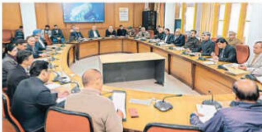
की ओर से विधेयकों के प्रारूप निर्धारित समयवाधि में ही मिलने चाहिए।

का आश्वासन दिया है। विधानसभा अध्यक्ष ने कहा कि सरकार के विभागों